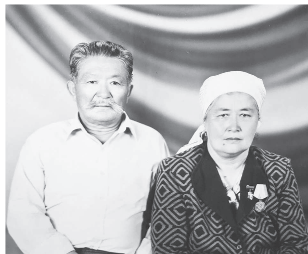
«Әке деген тас қорған, Сақтар басын жат жолдан. Ана деген қос бұлақ, Қандырған мейіріммен сусындап»