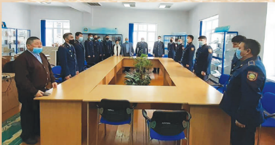
Тәуелсіздік күніне орай Талғар аудандық кітапханасының оқу залында «Тәуелсіздік тұғыры – ұлы дала арманы» атты іс-шара болып өтті.